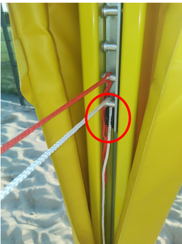
untere Spannvorrichtung gespannt : weißer Strick = im Spannklotz