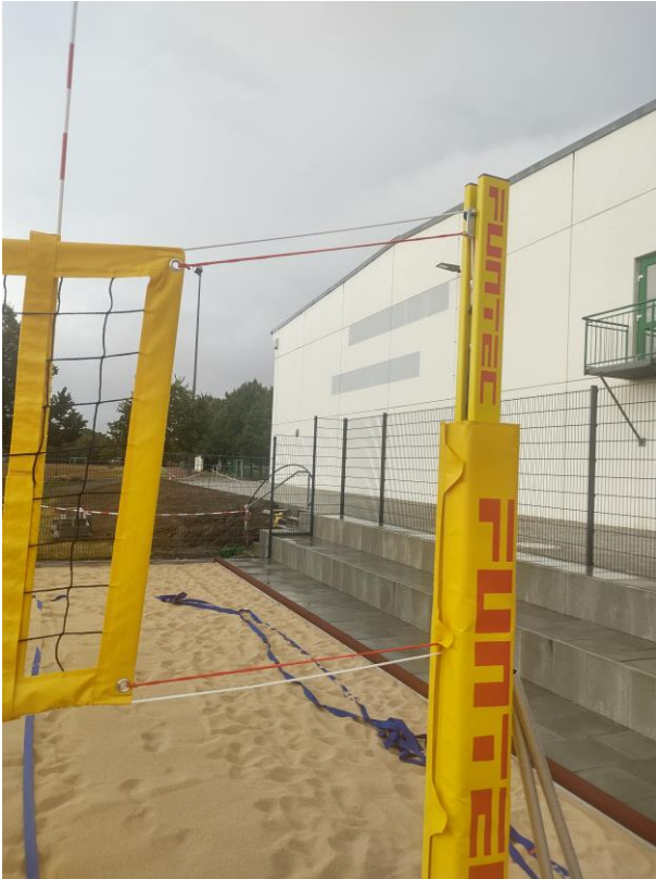
Hallenseite: keine Aktion notwendig