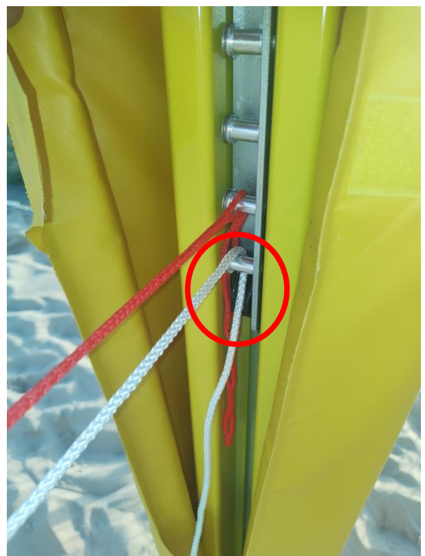
untere Spannvorrichtung entspannt : weißer Strick = außerhalb vom Spannklotz