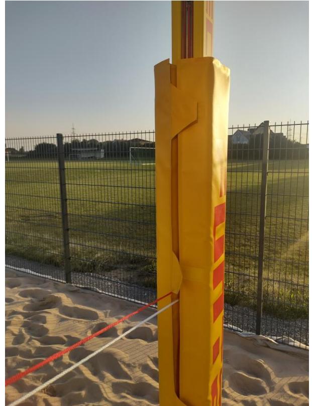
Rasenseite: Öffnen der Schutzhülle an den oberen 3 Klettverschlüssen